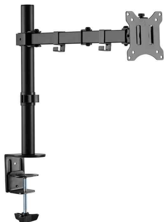
TFT- / LCD-Monitorarm, Armlänge: max. 390 mm