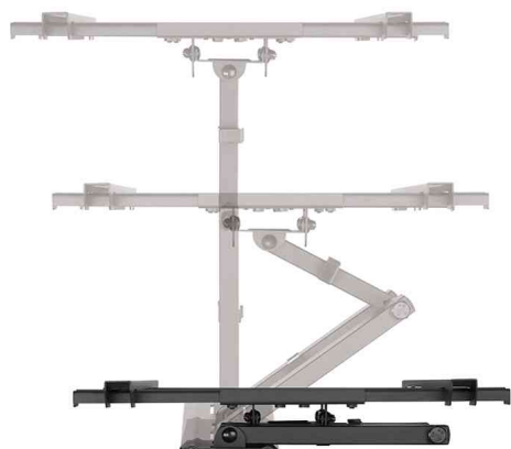
TV-Wandhalterung Full Motion