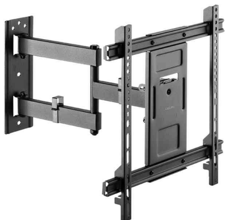
TV-Wandhalterung Full Motion