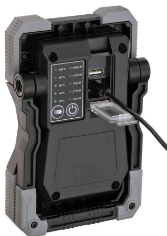
LED Akku-Arbeitsstrahler RUFUS, Rückansicht