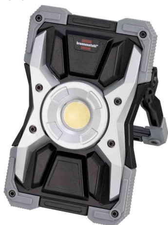
LED Akku-Arbeitsstrahler RUFUS