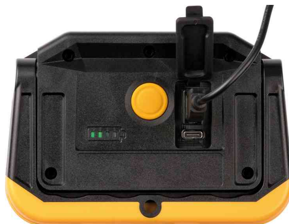
LED Akku-Arbeitsstrahler PF1000MA, Rückansicht