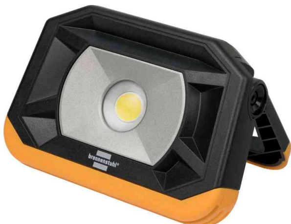
LED Akku-Arbeitsstrahler PF1000MA