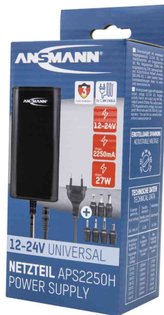
Universal-Steckernetzteil APS 2250H (ErP Level VI), in Verpackung