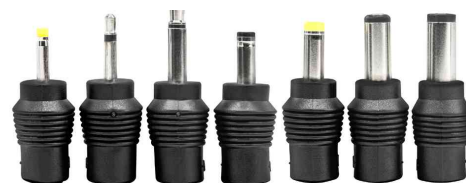
inkl. 7 verschiedenen Steckertypen