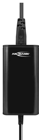
Universal-Steckernetzteil APS 2250L (ErP Level VI)