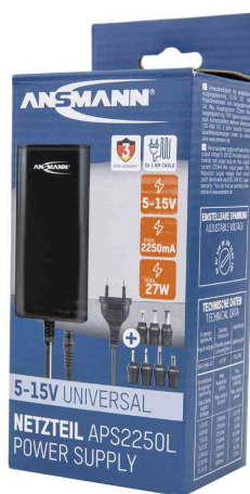
Universal-Steckernetzteil APS 2250L (ErP Level VI), in Verpackung