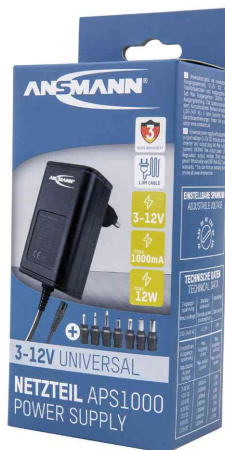
Universal-Steckernetzteil APS 1000 (ErP Level VI), in Verpackung