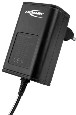
Universal-Steckernetzteil APS 1000 (ErP Level VI)