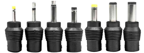
inkl. 7 verschiedenen Steckertypen