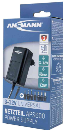
Universal-Steckernetzteil APS 600 (ErP Level VI), in Verpackung