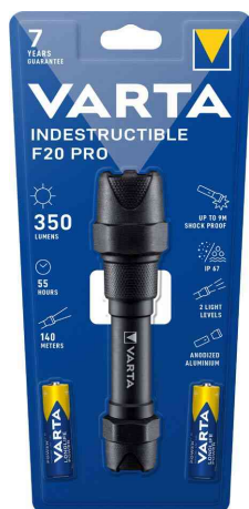
LED-Taschenlampe "Indestructible F20 Pro"