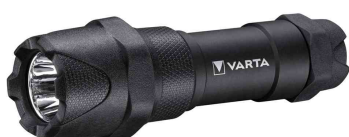
LED-Taschenlampe "Indestructible F20 Pro"