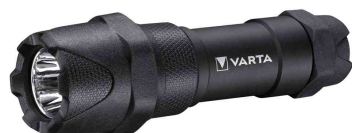
LED-Taschenlampe "Indestructible F10 Pro"