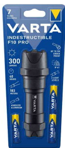
LED-Taschenlampe "Indestructible F10 Pro"