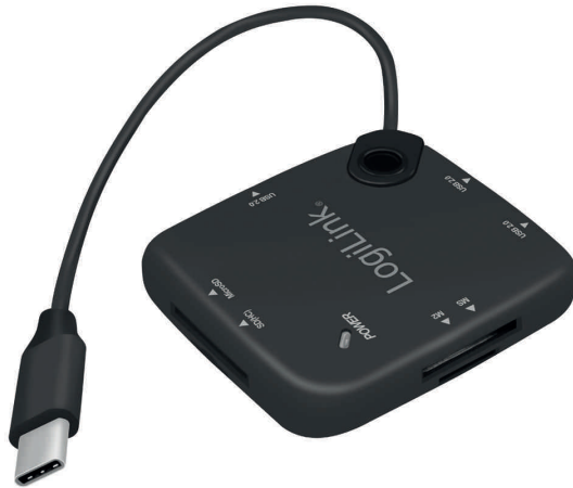
USB-C OTG (On-the-Go) Multifunktions-Hub mit Kartenleser