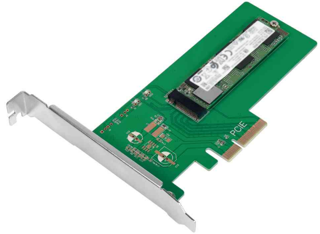
PCIe - M.2 PCI-Express Karte SSD