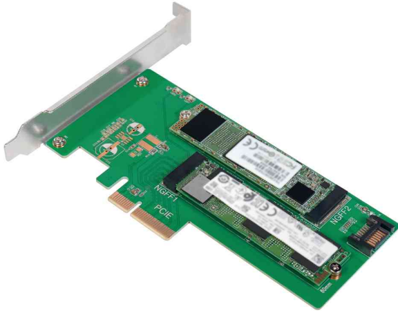
Dual M.2 PCI-Express Karte für SATA & PCIe SATA SSD

- kostengünstige Lösung, um eine M.2 (M Key) Schnittstelle in eine PCIe 3.0 x4 Schnittstelle zu konvertieren und die gesamte Speicherkapazität Ihres PCs oder Servers zu erweitern