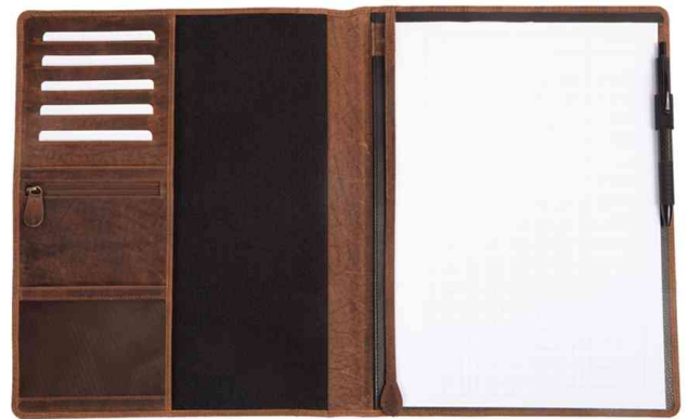
Schreibmappe "WINSTON", geöffnet