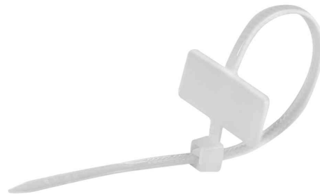
Kabelbinder mit Beschriftungsfeld