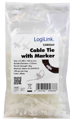
Kabelbinder mit Beschriftungsfeld, im Polybeutel