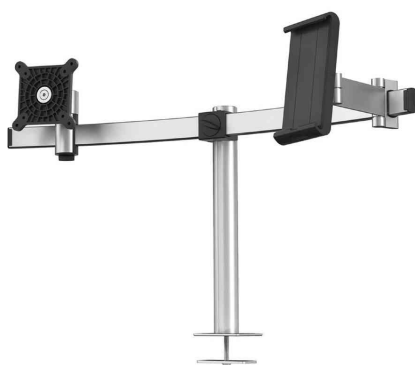
Monitorhalterung für 1 Monitor und 1 Tablet