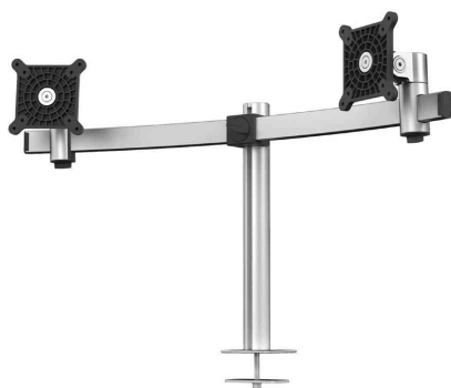
Monitorhalterung, mit Tischdurchführung