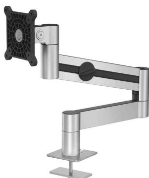
Monitorhalterung mit Tischdurchführung