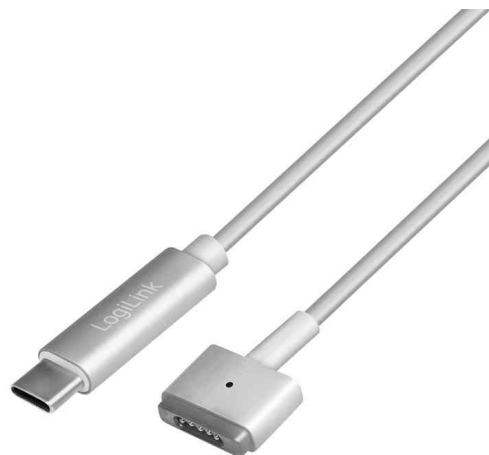
Ladekabel, Apple MagSafe 2 - USB-C Stecker