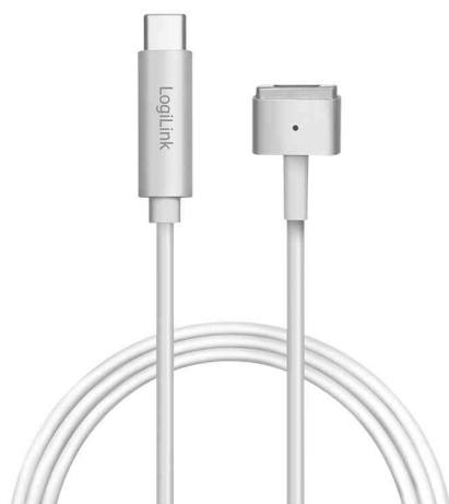
Ladekabel, Apple MagSafe 2 - USB-C Stecker