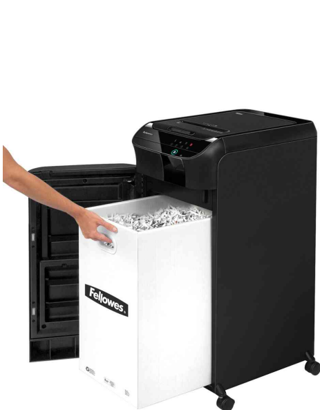
Aktenvernichter AutoMax 600M

- z.B. für Unterlagen mit Bilanzen und Konditionen, Gehaltsabrechnungen, Personaldaten / -akten, Arbeitsverträge, medizinische Berichte, Steuerunterlagen von Personen