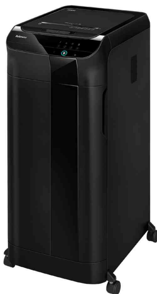
Aktenvernichter AutoMax 600M