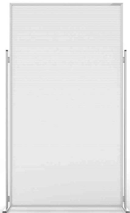
Raumteiler Evolution Acryl