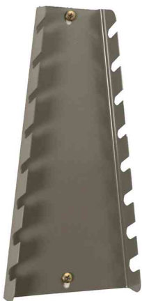
4) Schraubenschlüsselhalter "StorePlus Flex M 8"