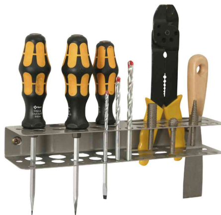
5) Werkzeughalter "StorePlus Flex M 31" - Lieferung unbestückt