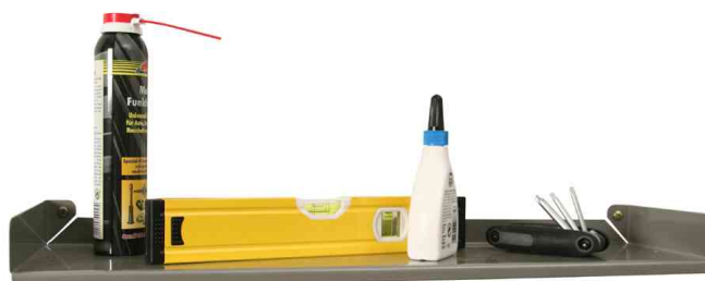
7) Ablageboard "StorePlus Flex M 58" - Lieferung unbestückt