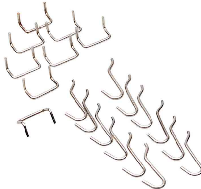
2) Haken-Set "StorePlus Flex M 20"