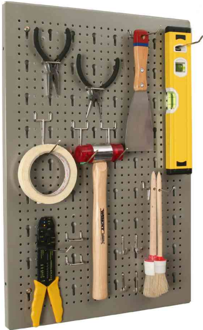
1) Werkzeuglochwand "StorePlus Flex M 60" - Lieferung unbestückt