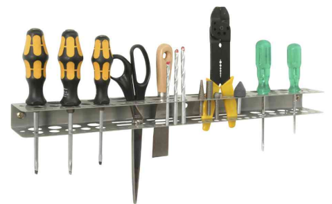
6) Werkzeughalter "StorePlus Flex M 62" - Lieferung unbestückt