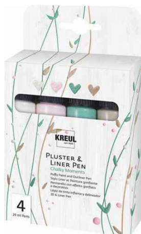
Pluster & Liner Pen, 4er-Set Chalky Moments