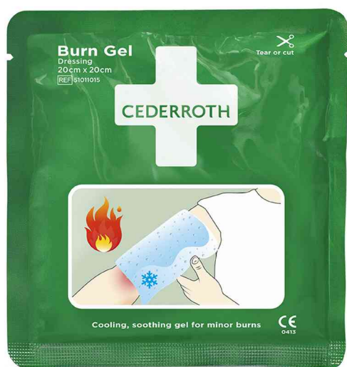
Kompresse Burn Gel Dressing, 200 x 200 mm