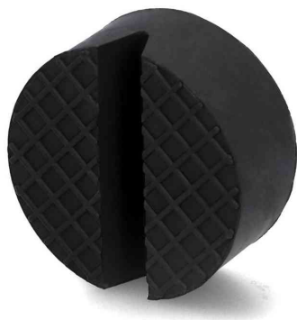
Gummiauflage für Wagenheber