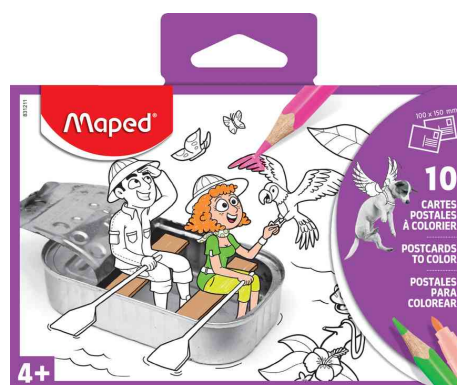
Postkarten-Set zum Ausmalen, 10-teilig