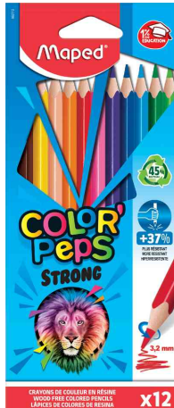
Dreikant-Buntstift COLOR'PEPS STRONG, 12er Kartonetui

24er Kartonetui: sortiert in den Farben schwarz, hautfarben, dunkelbraun, gaia, dune, marineblau, dunkelblau, hellblau, lagoonblau, grün, apfelgrün, jade, marshmallow, orange, pink, aubergine, rot, erdbeerrot, hellrot, silber, gold, sonnengelb, neon-gelb, weiß