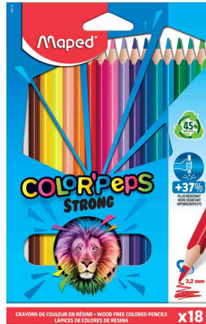
Dreikant-Buntstift COLOR'PEPS STRONG, 18er Kartonetui