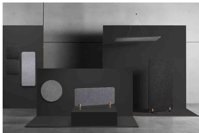
Deckenelement "Akustik Sculpo"