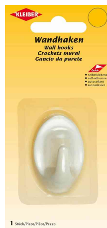
Wandhaken, medium - weiß