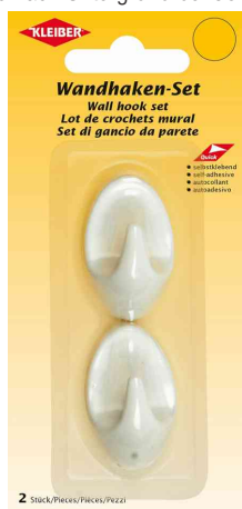
Wandhaken, klein - weiß