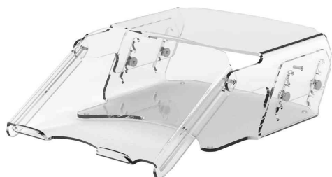
Monitorständer mit Dokumentenhalter Clarity™ Series