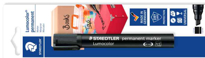
Lumocolor Signiermarker permanent marker, Blisterkarte