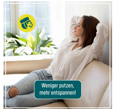
weniger putzen, mehr entspannen