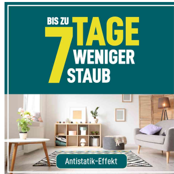
Antistatik-Effekt - bis zu 7 Tage weniger Staub