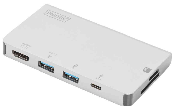
USB 3.0/3.1 Multiportadapter, 6 Port