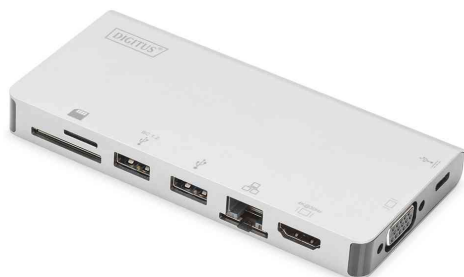
USB 3.0/3.1 Multiportadapter, 8 Port