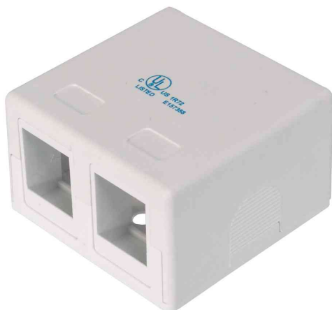
Konsolidierungspunkt-Gehäuse für 2 Keystone-Module

- zum Aufbau von Konsolidierungspunkten an Schreibtischen, in Zwischendecken oder in Unterflursystemen