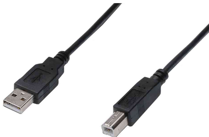
USB 2.0 Anschlusskabel, USB-A Stecker - USB-B Stecker