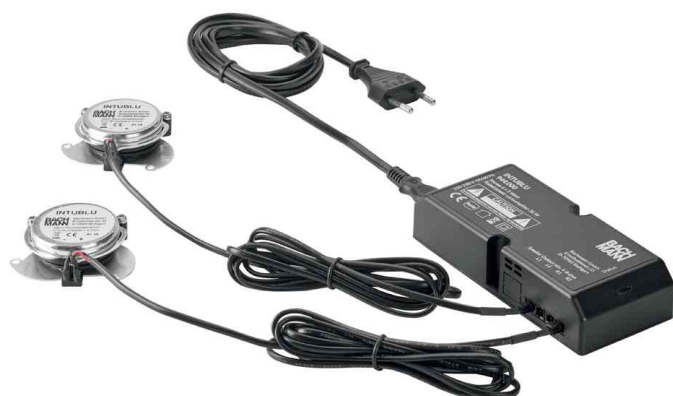
Audiosystem INTUBLU, mit Bluetooth-Receiver