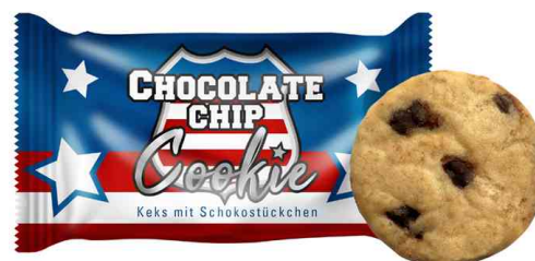
Gebäck "Chocolate Chips Cookies", Portion