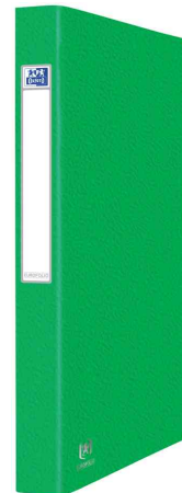
Ringbuch EUROFOLIO+, grün