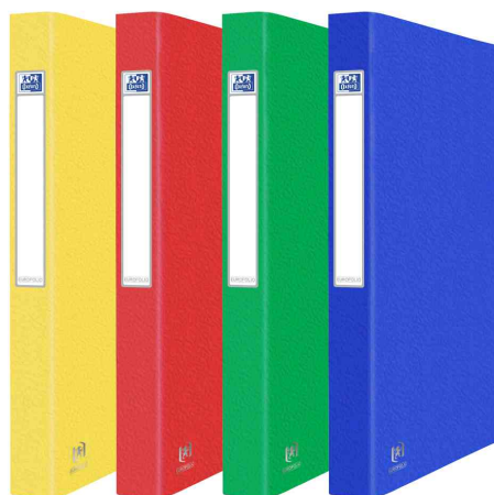
Ringbuch EUROFOLIO+, farbig sortiert