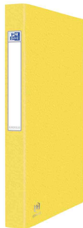
Ringbuch EUROFOLIO+, gelb