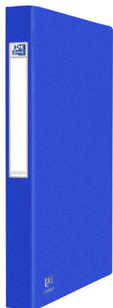
Ringbuch EUROFOLIO+, blau