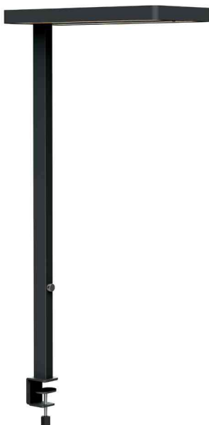
LED-Tischleuchte MAULjuvis, mit Klemmfuß, schwarz