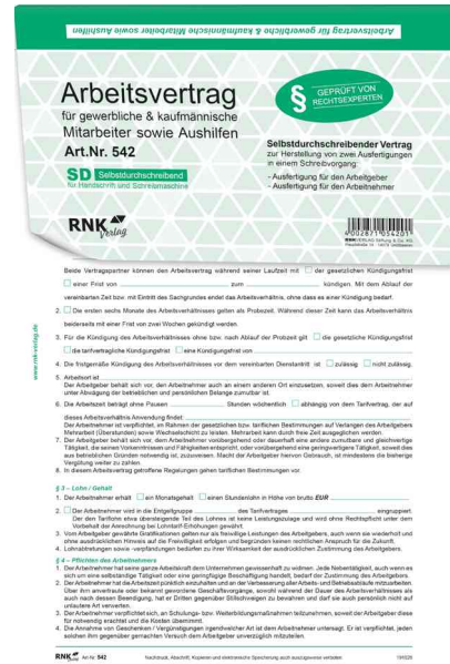
Vordruck "Arbeitsvertrag für gewerbliche & kaufmännische Arbeitnehmer"