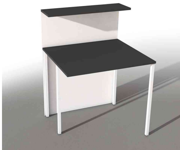
Erweiterungs-Element für Theke Cento