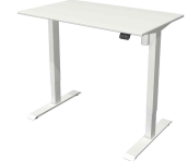
Beistell-Schreibtisch "Move 1", weiß N:\VivalP\Koepe\73262\3885_WEB.jpg