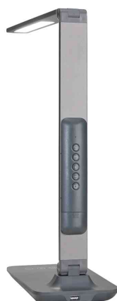
Detailansicht: zeigt die Rückseite der Leuchte