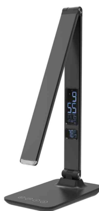
Detailansicht: zeigt das Display