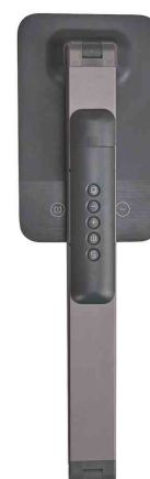
Detailansicht: zeigt die Lampe komplett zusammengeklappt