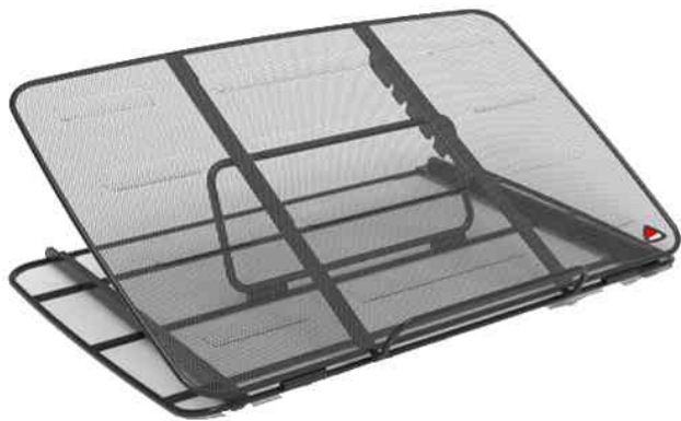
Multifunktions-Ständer "MESHSTAND", schwarz