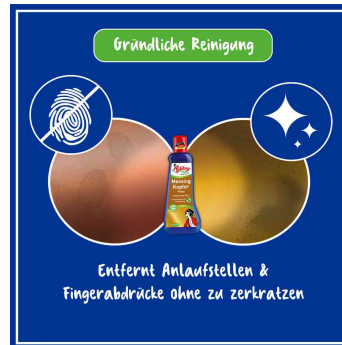
entfernt Anlaufstellen & Fingerabdrücke ohne zu zerkratzen