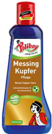
Messing Kupfer Pflege, 200 ml