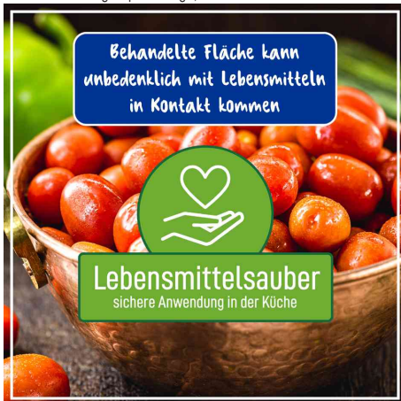
lebensmittelsauber - sichere Anwendung in der Küche