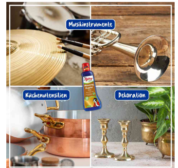
für Musikinstrumente, Küchenutensilien & Dekoration