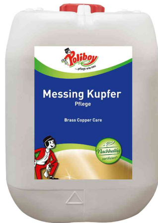
Messing Kupfer Pflege, 5 Liter