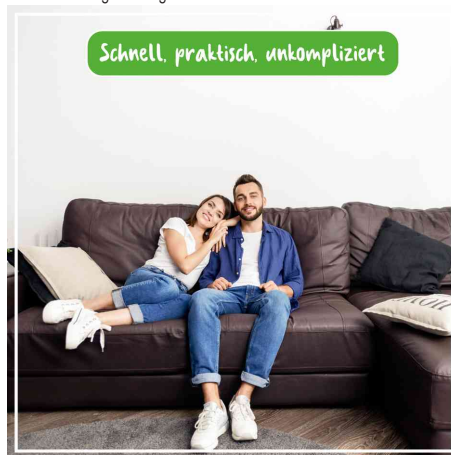
schnell, praktisch, unkompliziert