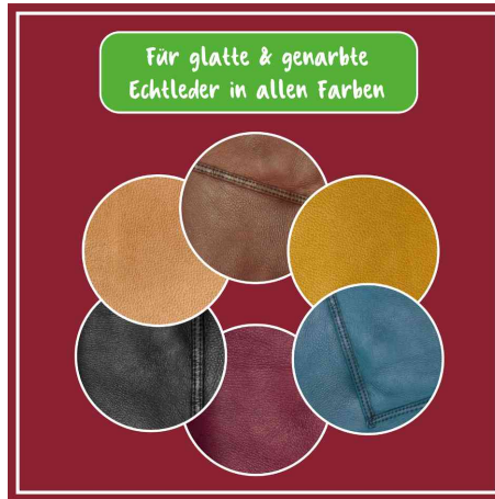
für glatte & genarbte Echlleder in allen Farben