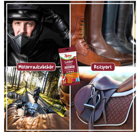
für Motorradzubehör & Reitsport