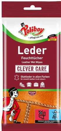
Leder Pflege Feuchttücher