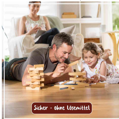
sicher - ohne Lösemittel