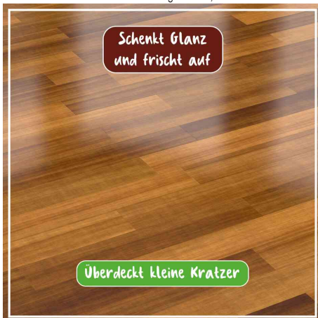
schenkt Glanz & frischt auf - überdeckt kleine Kratzer