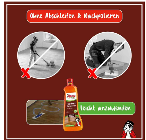
leicht anzuwenden - ohne Abschleifen & ohne Nachpolieren