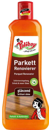
Parkett Renovierer glänzend, 500 ml