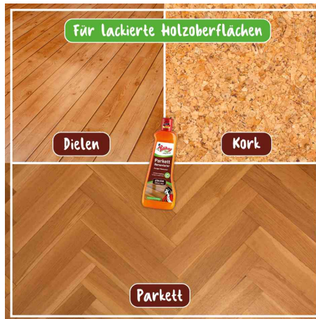
für lackierte Holzoberflächen: Dielen, Kork & Parkett