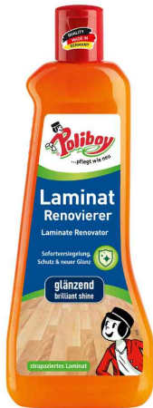
Laminat Renovierer, 500 ml