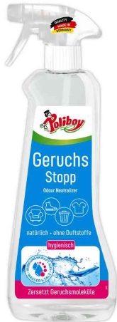
Aktiv Geruchs Stopp, 500 ml