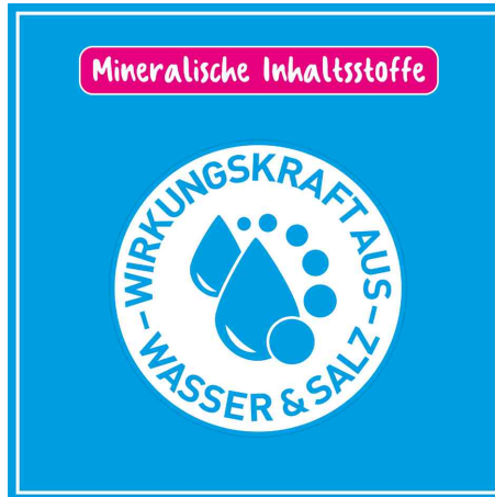
basiert auf Minerallösung aus Wasser und Salzen