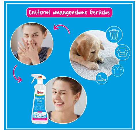
entfernt unangenehme Gerüche