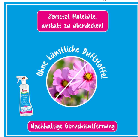
zersetzt Moleküle, anstatt zu überdecken